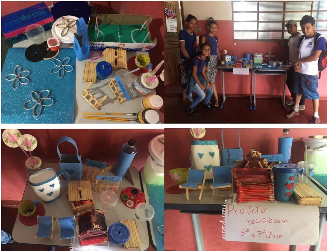
Dias da oficina de reciclagem e exposição no pátio da Escola