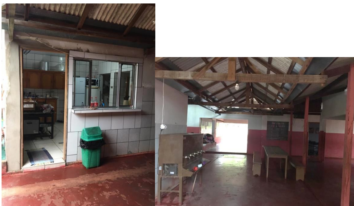
Cozinha e Refeitório