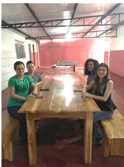
Reunião com as merendeiras e faxineiras