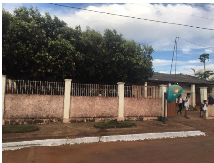
Entrada da Escola