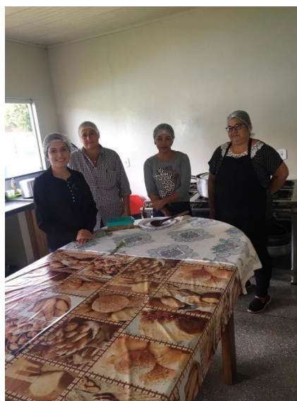
Reunião com as merendeiras e faxineiras