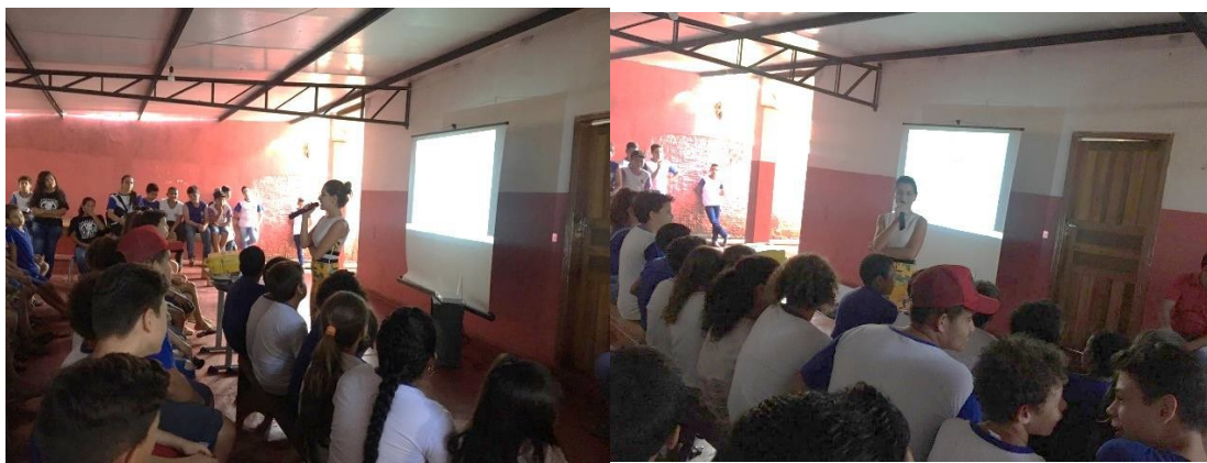
Dia da Palestra