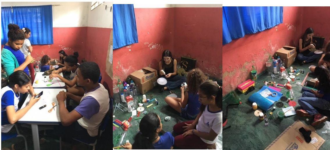
Dias da oficina de reciclagem