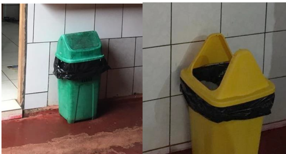
Lixeiras atualmente utilizadas