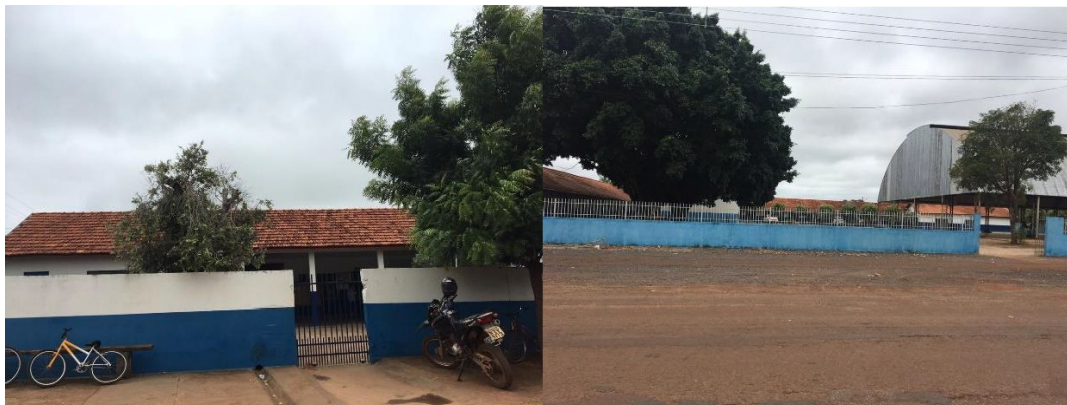
Entradas da Escola