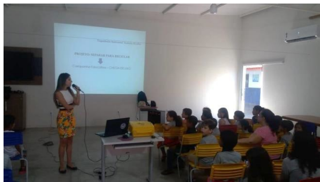
Dia da Palestra