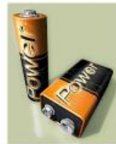
Pilhas 100 a 500 anos

A Coleta Seletiva deve ser tratada como uma rotina, relacionada a vida, pois não é um programa que tem começo, meio e fim, e sim uma relação “pessoa x meio que vive”