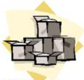
EMBALAGENS DE PAPEL um a quatro meses