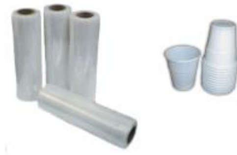
Sacos e copos plásticos 200 a 450 anos