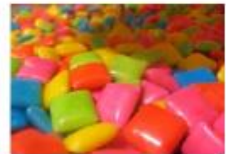
CHICLETES cinco anos