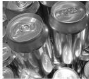
Latas de alumínio 100 a 500 anos