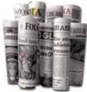
JORNAIS Duas a seis semanas